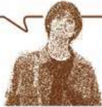
参加者 / 安東